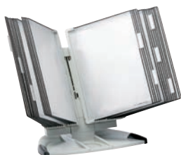
734 300 / 714 300