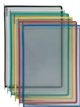
114/115 Serie / série