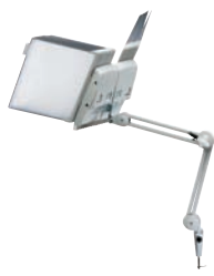
580 101 / 714 300