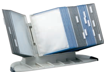
734 300 / 734 350 / 734 351