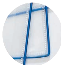
704 301 Detail