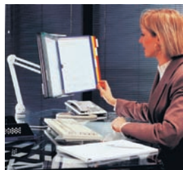
580 101 / 464 109

Metall, hellgrau lackiert. Mit eingebauter Feder, Klemme für Tischplatte bis 60 mm, mit Verbindungsstück. In der Höhe, Länge und Neigung verstellbar. Ermöglicht die Befestigung von 1 oder 2 Wandelementen.