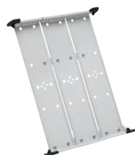
214 100 / 200 000