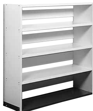
287 499 + 287 999