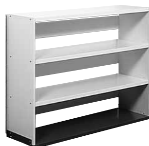
287 399 + 287 999