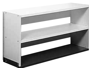
287 299 + 287 999