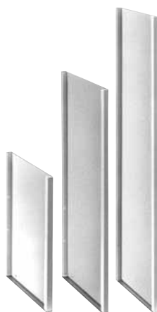
287 101 / 102 / 103