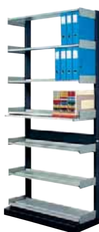
283 106 Dominal