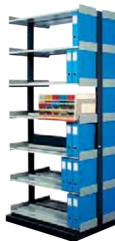
283 206 Dominal