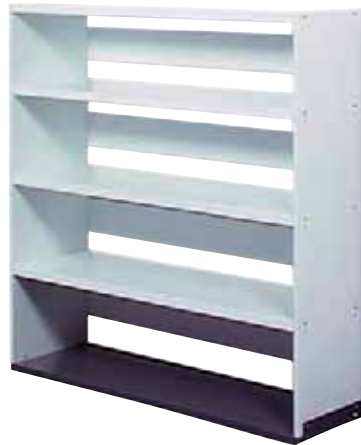
287 499 / 287 999