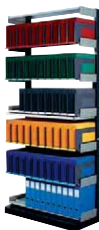
283 106 Universal

Pour bacs Universal 280 410 et Dominal 280 415.