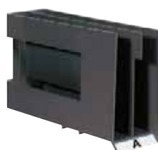
280 410 / 280 412