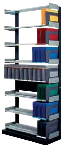
283 107 Universal

Pour bacs Universal 280 410 et Dominal 280 415.