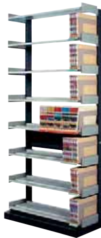
283 107 Dominal