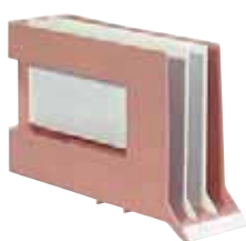
280 415 / 280 417