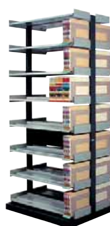
283 207 Dominal