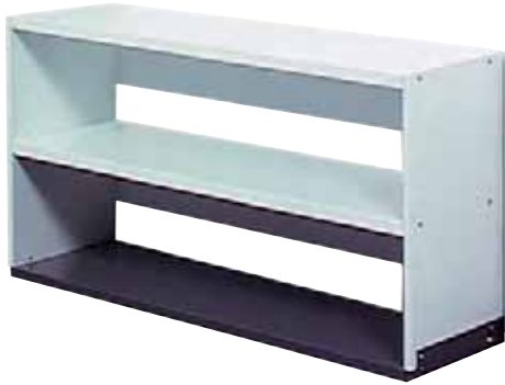
287 299 / 287 999

Tôle d'acier laquée en blanc, avec paroi dorsale, sans socle. Utilisables comme éléments de base ou superposables.