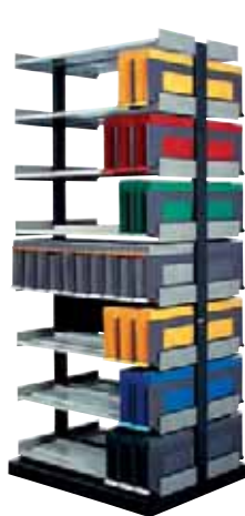
283 207 Universal