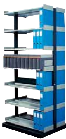
283 206 Universal