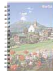
858 685 (Titelblatt)