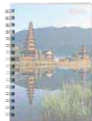
858 683 (Titelblatt)