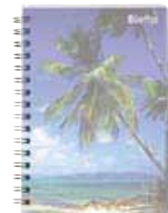
858 686 (Titelbild)