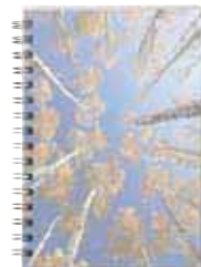
858 684 (Titelbild)