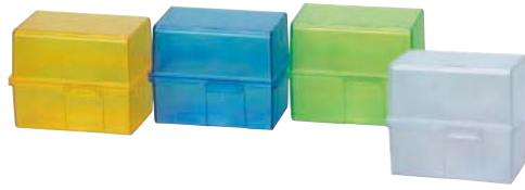
209 800 / 209 700