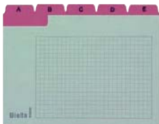
A7, A6, A5

Carton 450 gm 2 , 25 divisions, hauteur d'onglet 9 mm, onglets renforcés.