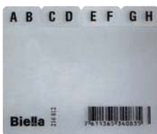
216 812 / 216 712