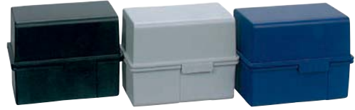
209 600 / 209 700 / 209 800